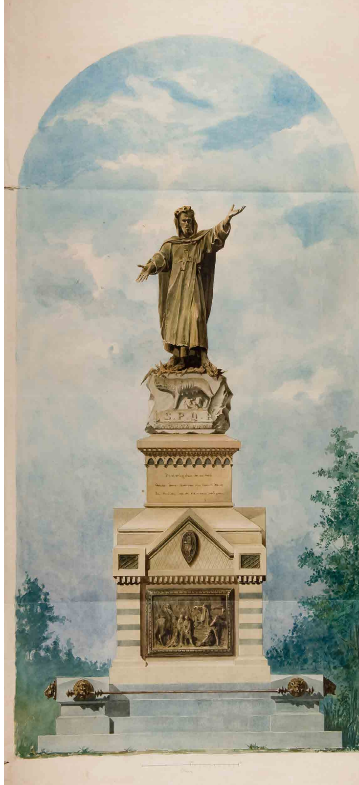
A DESTRA O. Tabacchi (attribuito), Proposta per il monumento ad Arnaldo da Brescia Acquerello su carta, 1869 (?) Lonato del Garda, Fondazione Ugo Da Como, donazione Tagliaferri 2010

Questa iniziativa, espositiva e di studio, nasce dalla sinergia da tempo avviata tra la Fondazione Ugo Da Como, la Fondazione Brescia Musei, la Fondazione CAB e l'Associazione Amici dei Musei di Brescia. Queste realtà intendono contribuire alla valorizzazione del vasto patrimonio storico, artistico e culturale presente non solo nella Città di Brescia, ma in tutto il suo territorio.