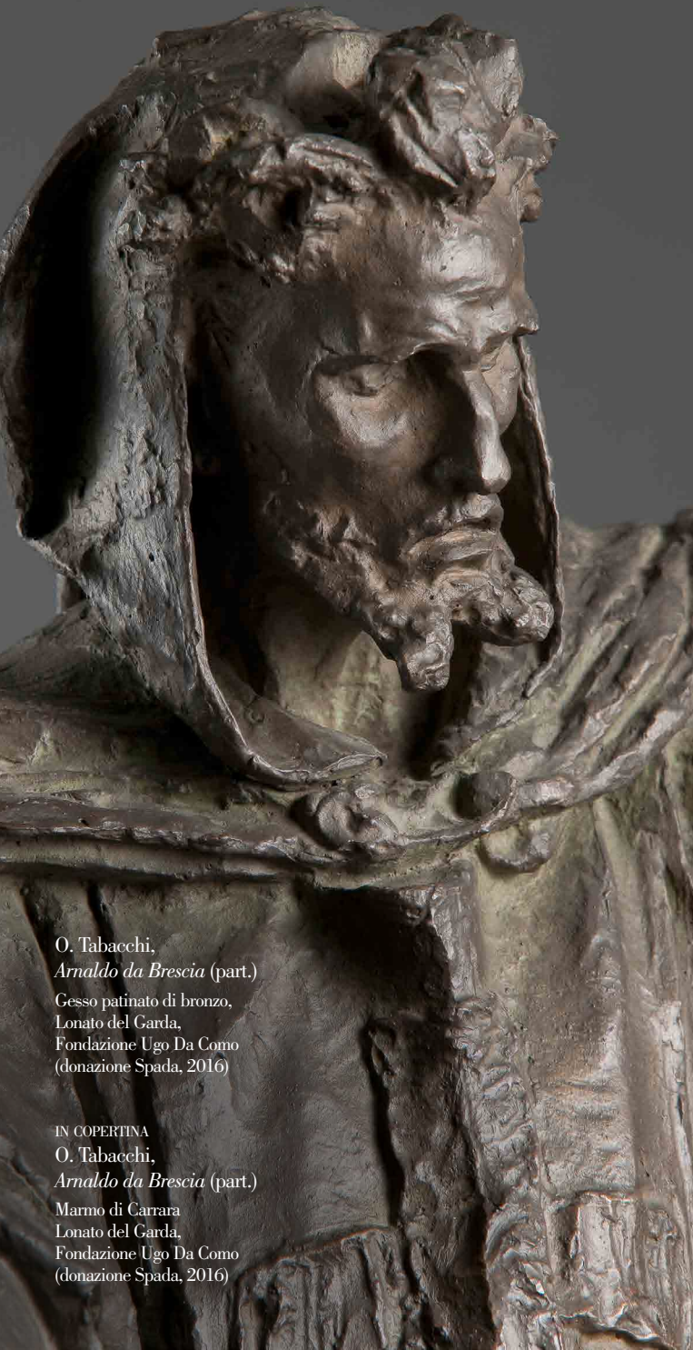
O. Tabacchi, Arnaldo da Brescia (part.) Gesso patinato di bronzo, Lonato del Garda, Fondazione Ugo Da Como (donazione Spada, 2016)