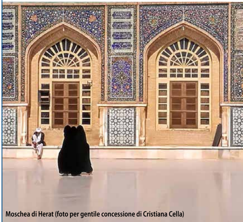
Moschea di Herat