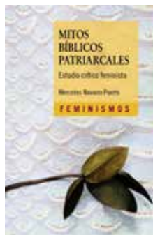
Mercedes Navarro Puerto, Mitos bíblicos Patriarcales , Càtedra, Meco (Spagna) 2022