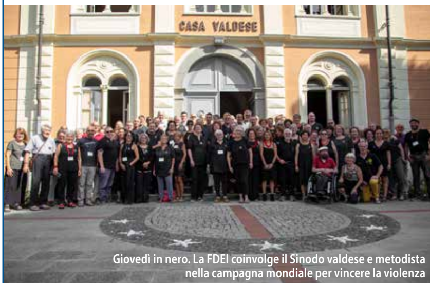
Giovvedì in nero. La FDEI coinvolge il Sinodo valdese e metodista nella campagna mondiale per vincere la violenza