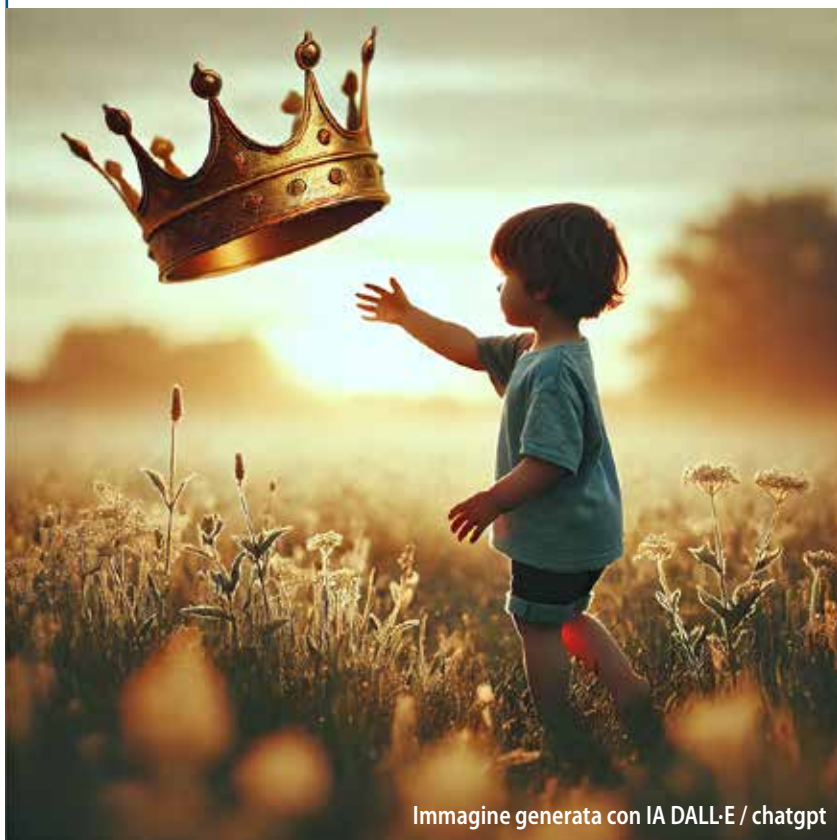
Immagine generata con IA DALL-E / chatgpt

E lena Gianini Belotti scriveva: “Per quanto ci si metta dalla parte delle bambine è chiaro che non sono soltanto le bambine le vittime di un condizionamento negativo in funzione del loro sesso [...] cosa può trarre di positivo un maschio dalla arrogante presunzione di appartenere a una casta superiore? La sua è una mutilazione altrettanto catastrofica di quella della bambina persuasa della sua inferiorità. Il suo sviluppo come individuo ne viene deformato e la sua personalità impoverita, a scapito della loro vita in comune”. Sii uomo, non fare la femminuccia: questa ingiunzione ci insegue sin da piccoli, ma non basta avere un corpo di uomo per esserlo. Gli uomini hanno percepito il potere generativo femminile e ingaggiato una lotta millenaria contro la corporeità che li condannava a finitezza e accessorietà. Hanno inventato una gerarchia mente-corpo, tra generazione “biologica” e sociale, tra razionalità e emozioni. Ci hanno raccontato che il nostro corpo era una macchina da performance , un’arma da portare in guerra, una parte bassa di noi da imporre con denaro, forza, potere. Un vicolo cieco che produce esperienza alienata. Rimuovere desiderio e soggettività femminile produce miseria. Il mito maschile rattrappisce la socialità, liquida il nostro corpo come inabile alla cura, impone